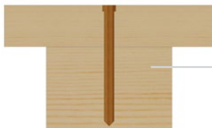
Fassade mit Brett direkt auf Unterkonstruktion