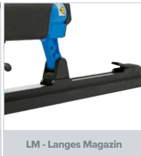
LM - Langes Magazin